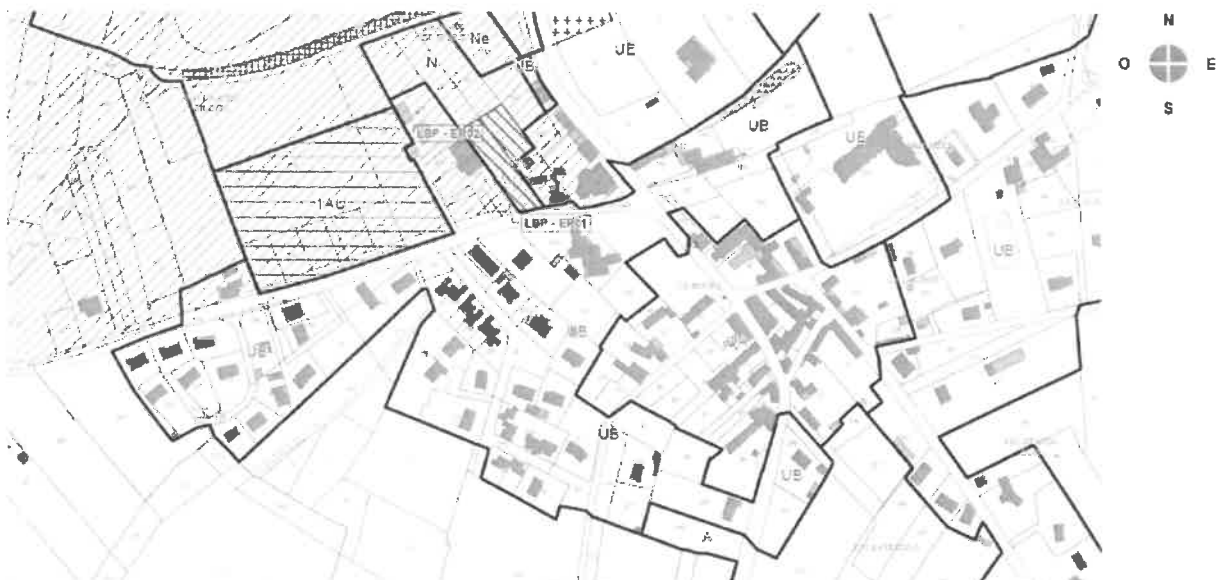
Plan de zonage

La commune souhaite engager un programme d'aménagement d'ensemble sur un ensemble de terrains classés 1AU « La Croix du Jubilé - rue Saumuroise » d'une surface approximative de 13 500 m 2 .